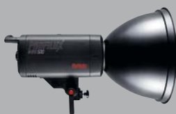
LUXSTU 5* Blitzgerät, 500 Ws