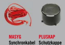
MASYG Synchronkabel PLUSKAP Schutzkappe