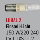
LUHAL 2 Einstell-Licht, 150 W/220-240 V für LUXSTU-2